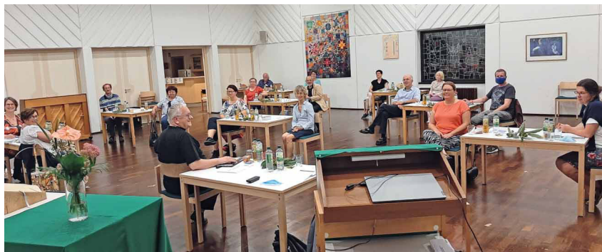
Kontaktaufnahme mit Abstand